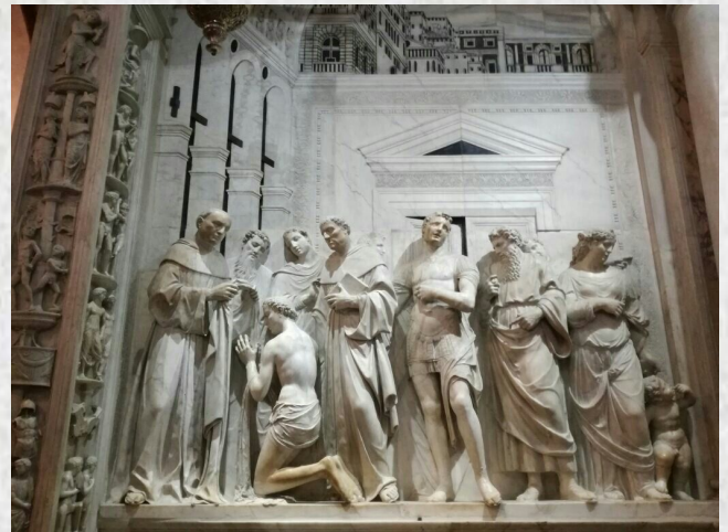
A.Minello, 1512. Vestizione di sant'Antonio, particolare

Ti preghiamo, signora nostra, speranza nostra: tu, stella del mare, illumina i tuoi figli travolti da questo tempestoso mare del peccato; facci giungere al porto sicuro del perdono e, lieti della tua protezione, possiamo portare a compimento la nostra vita. Con l'aiuto di colui che tu hai portato in grembo e che il tuo santo petto ha nutrito. A lui è onore e gloria per i secoli eterni. Amen. (di Sant'Antonio)