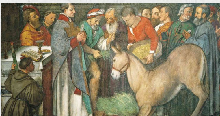
Riproduzione del miracolo dell'eucaristia

Rimini era uno dei centri più vivi dell'eresia catara in Italia (eresia che si sviluppò intorno al 1190/1250 e che vide tra i suoi più strenui oppositori san Domenico. Il principio di base si regge su due pilastri, terra e cielo, uno cattivo e l'altro buono. La materia è opera del dio cattivo – quindi la carne è maledetta e quanto ad essa collegata doveva essere evitata: quindi niente relazioni sessuali, niente cibi di carne o derivati. A partire da questo concetto, anche l'Incarnazione di Gesù veniva negata perché Cristo non poteva corrompersi con la carne). Ebbene, a Rimini c'era un eretico che scherniva continuamente Antonio a riguardo dell'Eucaristia, negando la presenza reale di Cristo. A un certo punto Antonio dichiarò che anche la mula che l'eretico cavalcava avrebbe adorato il Signore presente nell'Eucaristia. La sfida fu raccolta. La mula venne lasciata tre giorni senza cibo e portata così in piazza: da un lato giunse l'eretico con una cesta piena di fieno e dall'altra Antonio con l'ostensorio contenente l'Eucaristia. Ed ecco la folla numerosa per l'evento poté vedere che la mula si volgeva verso l'Eucaristia e, ancor più, piegava davanti ad essa i ginocchi, come se volesse adorare.