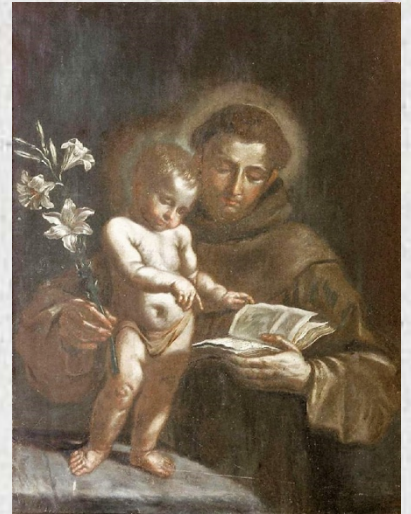
Sant'Antonio, Museo Francescano virtuale

Bambinello. Il riferimento è al miracolo di Camposanpiero, del quale ne abbiamo parlato nel paragrafo poco prima della morte.