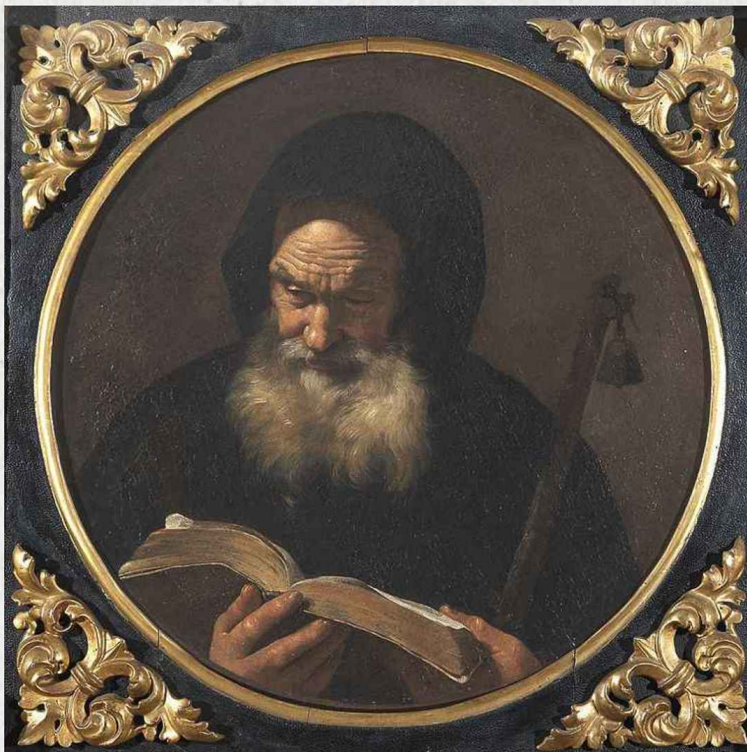
Sant'Antonio abate, Olio su tela di Mattia Preti (1640)