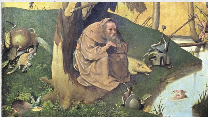
Antonio tentato, Galleria del Prado, Madrid

Fu amico di sant'Atanasio (Vescovo di Alessandria), che aiutò nella sua lotta contro gli ariani (eresia fondata da Ario, la quale dichiarava che Gesù non era vero figlio di Dio: nel Concilio di Nicea del 325 l'eresia venne condannata). Ad Antonio si deve l'inizio della vita anacoretica, cioè della vita di solidari dimoranti nello stesso luogo ma non legati da regole: differente degli eremiti, i quali invece vivevano inizialmente insieme sotto la guida di un anziano, occupando ognuno una cella, separata ma vicina alle altre. Non si è in possesso delle sue lettere, tranne una indirizzata all'abate Teodoro e ai suoi monaci. Di altro, di autentico, non c'è.