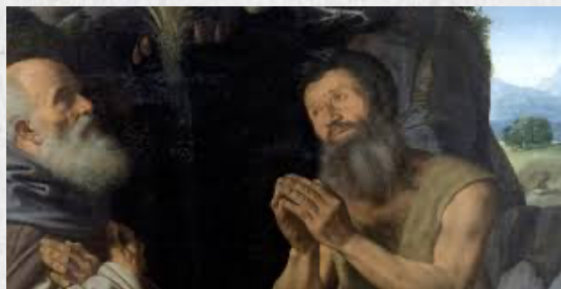
I santi Antonio Abate e Paolo eremita, Accademia di Venezia